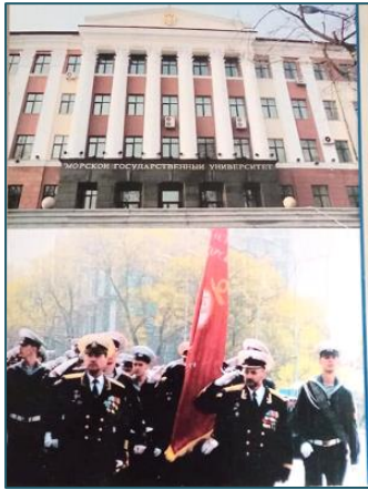
Курсанты МГУ им. адм. Г.И. Невельского проходят практику в 19-й бригаде подводных лодок

Исторически сложилось, что львиную долю практик курсанты проходили на подводных лодках, базирующихся на территории Приморского края. А обучали их профессиональные военные моряки, прошедшие в толще океана сотни и сотни миль. Много разных реформ и перестроек в новой России пришлось пережить вначале факультету, затем кафедре военного обучения МГУ имени адм. Невельского, но верность традиции – учиться на совесть – офицеры сохранили навсегда. Потому что бывших военных моряков не бывает.