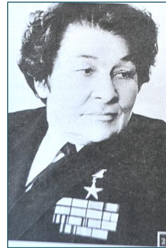
А.И. Щетинина, первая женщина-капитан, Герой Социалистического Труда