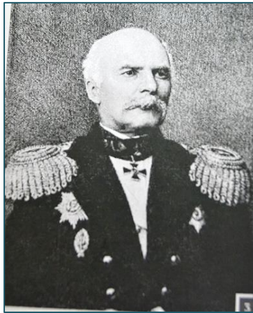
Адмирал Г.И. Невельской, чье имя носит Морской государственный университет

плавания, изучались турецкий, греческий и итальянский языки. Выпускники училищ освобождались от рекрутства, телесных наказаний и подушного оклада. Попытка учредить навигационные классы при уездных училищах не оправдала себя, и в 1842 году в некоторых городах были открыты самостоятельные шкиперские курсы.