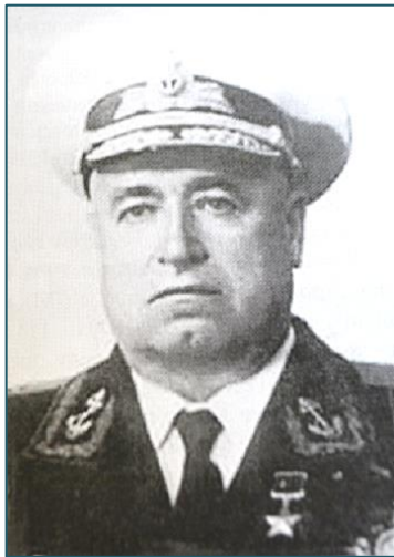
Г.И. Щедрин, командир легендарной ПЛ С-56, вице-адмирал, Герой Советского Союза